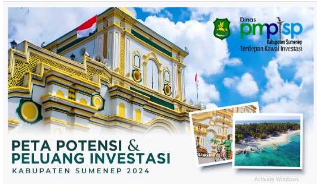
Gambar 1.2 Sumenep Investment Project Ready to Offer (SIPRO) Kabupaten Sumenep